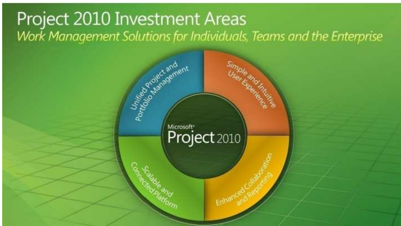
Rysunek 2. Obszary inwestowania Microsoft Project 2010