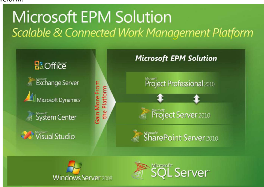
Rysunek 4. Architektura rozwiązania Microsoft EPM